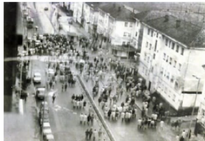
Ferrol, 10 de marzo de 1972