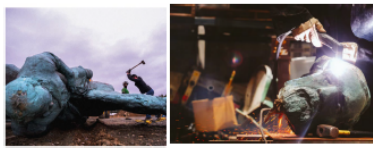
Destrución de estatua do xeneral Robert E. Lee en Charlottesville, Virginia