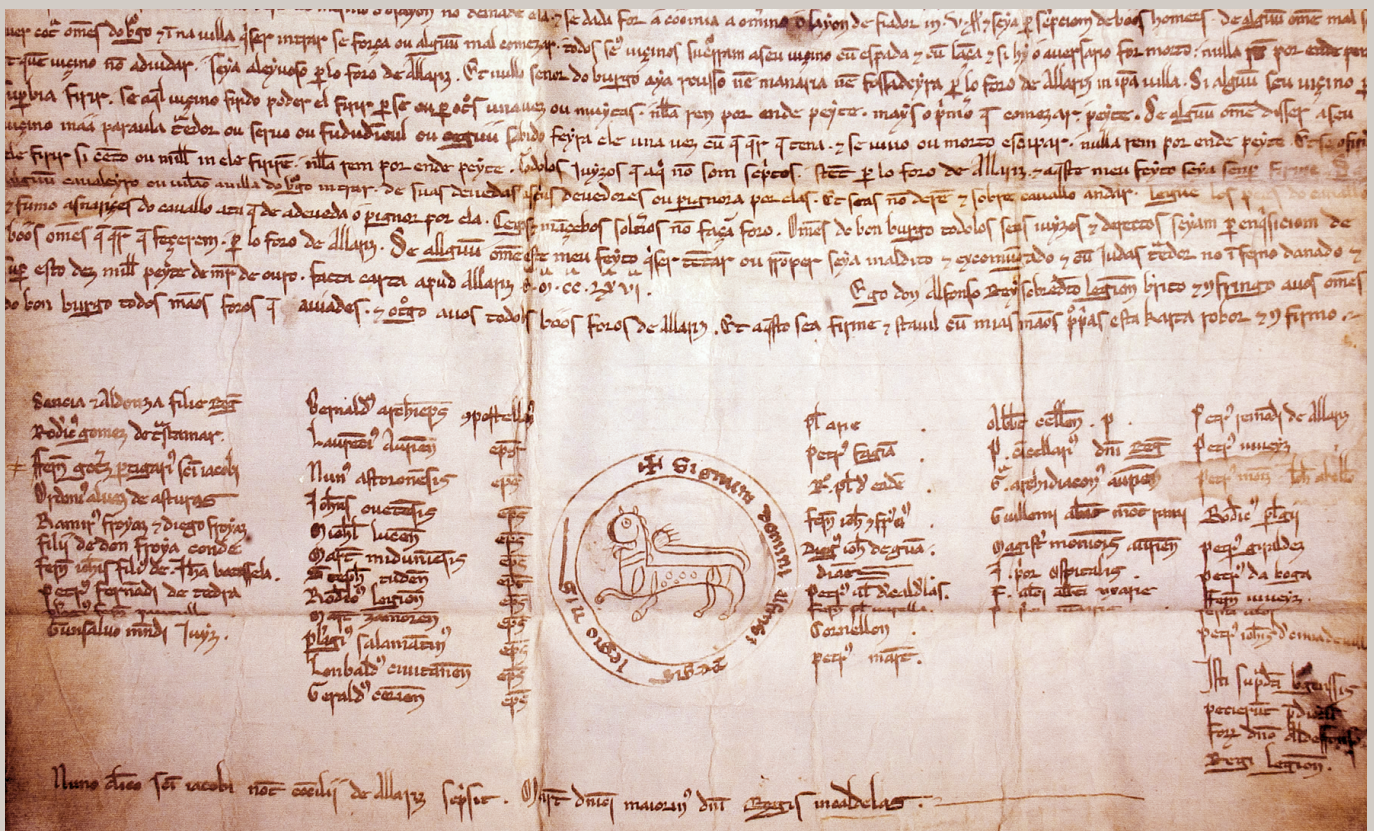
↑ Fragmento do Foro do Bo Burgo de Castro Caldelas, 1228.