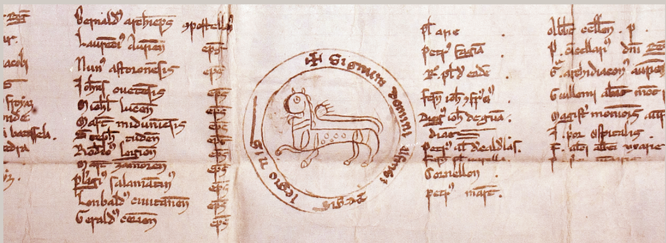
† Fragmento do Foro do Bo Burgo de Castro Caldelas, 1228.