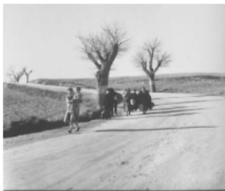
Kati Horna. Evacuación de Teruel, 1937. Centro Documental de la Memoria Histórica